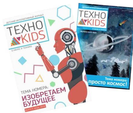
Журнал «ТЕХНО KIDS»

Детский интерактивный журнал о науке и технике, создаваемый детьми для детей